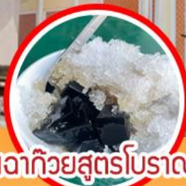
เจดีย์ยุทธโรรส