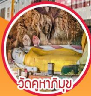
วัดคูหาภิมุข