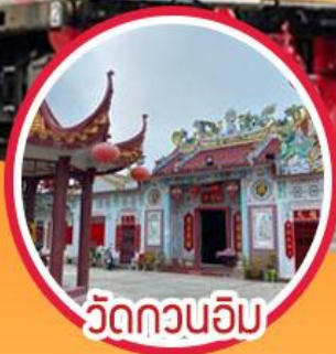
วัดควนอิม